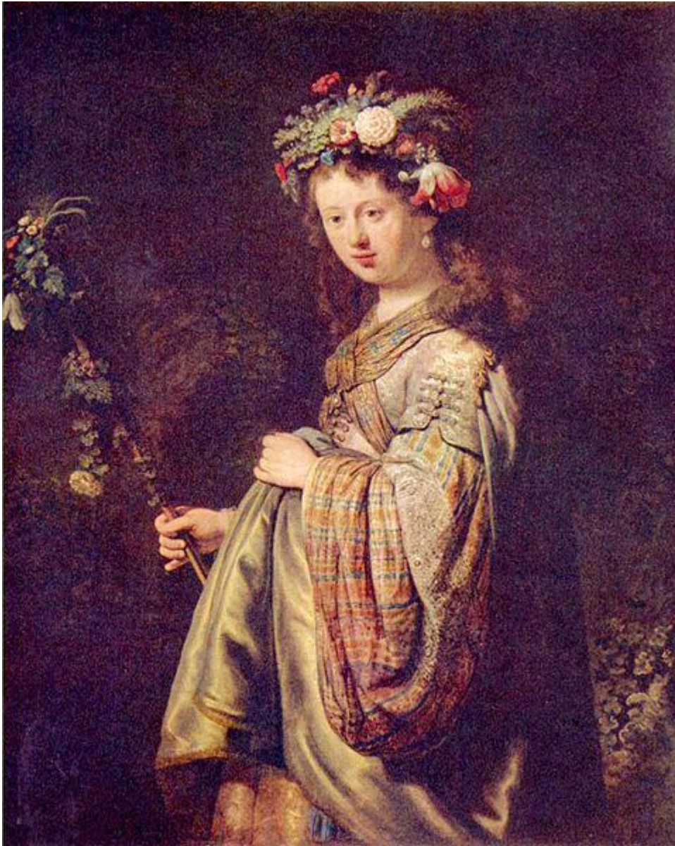
Οι άγιοι Φλώρος και Λαύρος