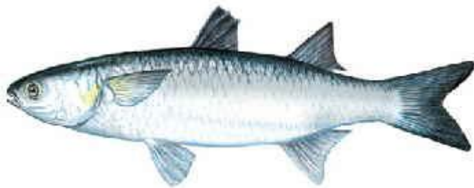
Εικόνα 2 - Κέφαλος